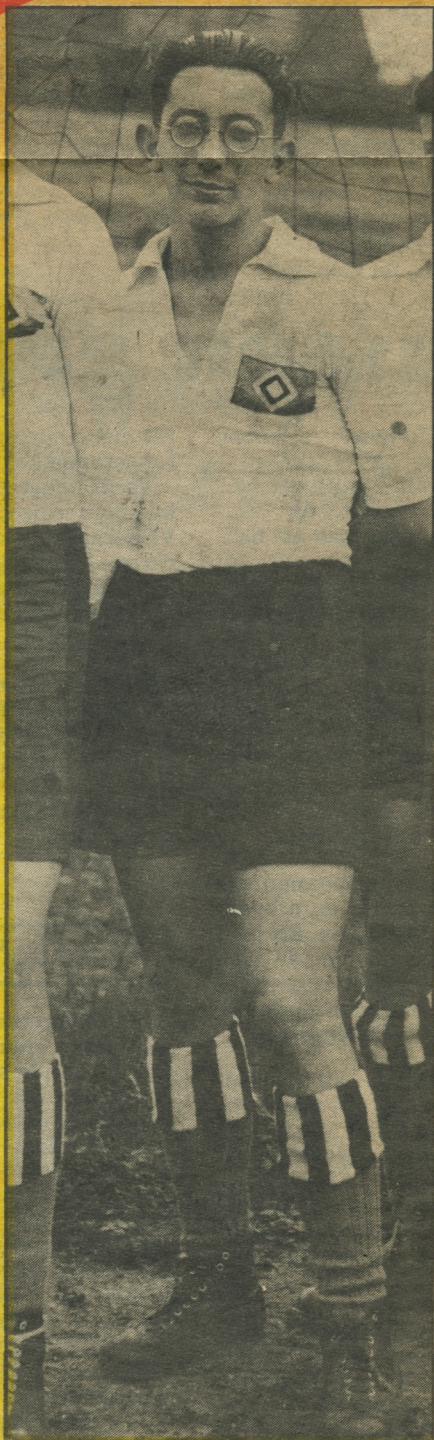
På den tiden när Hamburger SV ännu var ett hyggligt lag...